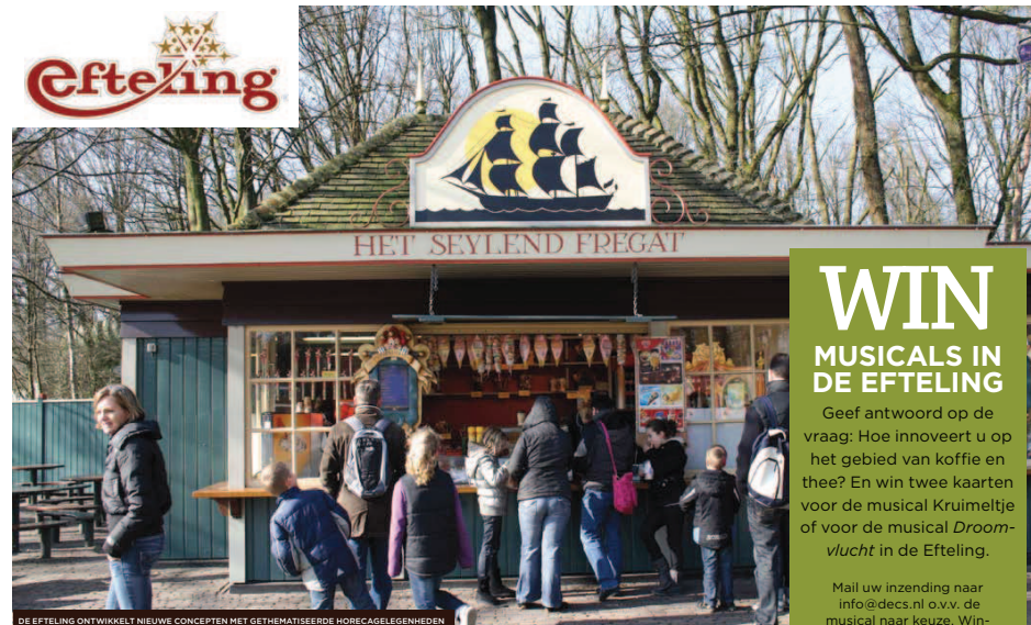
DE EFTELING ONTWIKKELT NIEUWE CONCEPTEN MET GETHEMATISEERDE HORECAGELEGHEDEN

Douwe Egberts informeert ons over nieuwe ontwikkelingen en biedt diensten en producten aan die op de Efteling-beleving aansluiten. De koffie moet bij ons minstens zo goed zijn als bij de mensen thuis. En die wordt steeds beter. Je moet als Efteling blijven innoveren.'