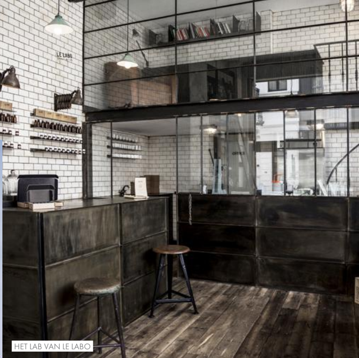
HET LAB VAN LE LABO