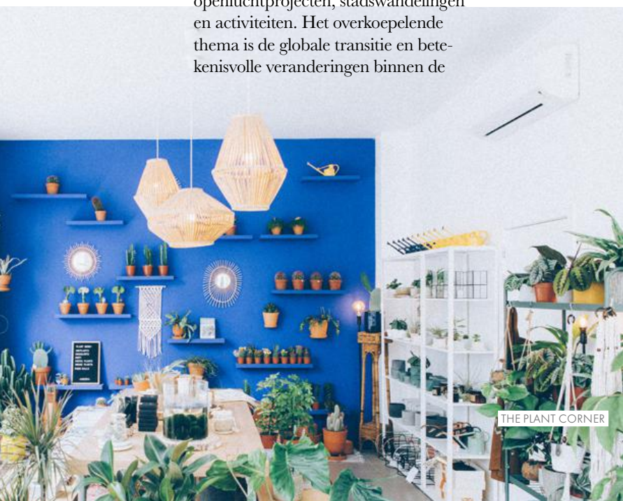
THE PLANT CORNER